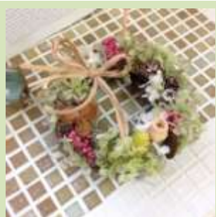
アジサイの色:グリーン系 プリザーブドローズ無し

枯れない花で素敵な 「アジサイと木の実のリース」 を作いませんか？ 残暑が残るこの時期 生花だとすぐ枯れて しまいますが、これなら 長く楽しんで頂けます♪