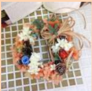
アジサイの色:オレンジ系 プリザーブドローズあり